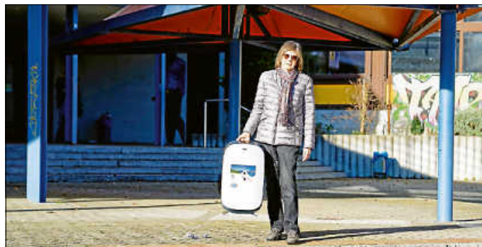
Luftreiniger für die THR-Mensa

Corona fordert uns alle. Der Förderverein hat nun für die "Mensa" der THR ein Luftfiltergerät angeschafft. Dieser Raum im Untergeschoss kann nur über die Fenster in den Lichtschächten belüftet werden. So stehen diese Fenster oft offen und der Raum kühlt aus - mitsamt dem Essen. Künftig muss mit dem Luftreiniger nicht mehr ganz so häufig kalte Außenluft hereingelassen werden.