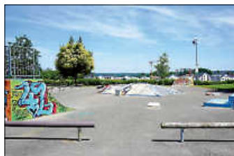
Skater-Anlage an der Schwarzwaldhalle