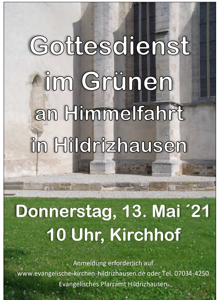
Plakat: Evang. Kirchengemeinde Gärtringen