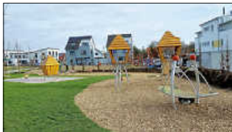
Spielplatz „Im Lammtal“