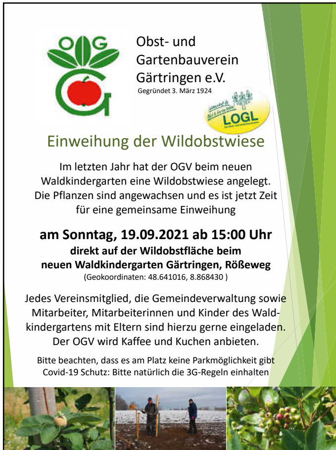
Plakat: Obst- und Gartenbauverein