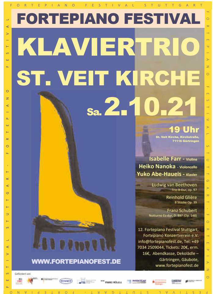
Plakat: Konzertverein Fortepiano e. V.