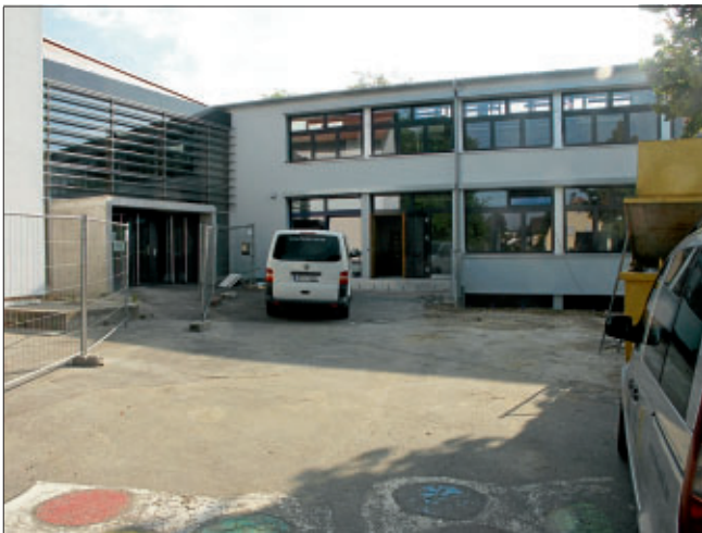
Unser Bild zeigt den renovierten Fachklassenbau und den neuen Haupteingang der Ludwig-Uhland-Schule

Mit Hochdruck arbeiten die Handwerker an der Fertigstellung des komplett umgebauten Fachklassenbaus, der energetischen Sanierung der Schulpavillons und der Einrichtung für die Räumlichkeiten der Nachmittagsbetreuung mit Mittagstisch an dieser Grund- und Hauptschule. Zum Schuljahresanfang soll die Schule für den Schulbetrieb zur Verfügung stehen, bis dahin bestimmen noch die Handwerker das Bild um alles fristgerecht fertigzustellen. Fachklassenräume für Technik, EDV, Hauswirtschaft und Naturwissenschaften werden im Fachklassenbau neu entstehen und wurden an der Stelle errichtet, an der sich bisher die Verwaltungsräumlichkeiten und die Aula befanden, für die ja bereits im vergangenen Jahr ein Neubau entstehen konnte.