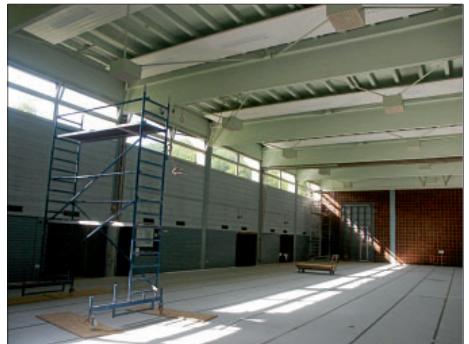
Unser Bild zeigt die neuen Deckenstrahlheizungsplatten mit der integrierten neuen Beleuchtung in der Schönbuchhalle

In der Schönbuchhalle ist derzeit auch reges Schaffen zu beobachten. Elektriker, Heizungs- und Lüftungstechniker und andere Handwerker sind vertreten um die Heizungs- und Lüftungsanlage der Halle auf Vordermann zu bringen und die Halle auch energetisch durch entsprechende Isolierungsmaßnahmen auf einen aktuellen Stand zu bringen. Hauptbestandteile sind dabei die neue Lüftungsanlage und die Heizungstechnik, die von Öl auf Gasbetrieb mit Brennwerttechnik umgestellt wird und anstelle der bisherigen Warmluftheizung wurden Deckenstrahlplatten mit integrierten Beleuchtungskörpern installiert, so dass sich gleichzeitig die Beleuchtung in der Halle deutlich verbessern wird und zusätzlich voraussichtlich 4200 kw/h Strom jährlich eingespart werden. Nach den Sommerferien wird die Halle wieder von den Sportlerinnen und Sportlern des SV Rohrau und der Joseph-Haydn-Grundschule genutzt werden und auch die kulturellen Veranstaltungen der Vereine werden durch die neue Beheizung, Belüftung und Beleuchtung und das dadurch deutlich verbesserte Raumklima profitieren.