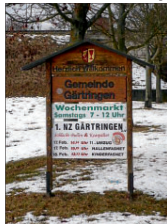
Nicht mehr zeitgemäß - die Ortseingangsschilder aus dem Jahr 1991