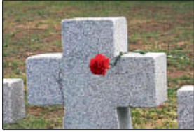
Unterstützung für Bau und Pflege von Kriegsgräberstätten in Osteuropa.

Der Volksbund Deutsche Kriegsgräberfürsorge e. V. pflegt derzeit die Gräber von ca. 2,4 Millionen Opfern von Krieg und Gewaltherrschaft, darunter Gefallene aber auch zivile Personen. Seit den 90er Jahren, arbeitet der Volksbund schwerpunktmäßig in Osteuropa. Dort hat die gemeinnützige und humanitäre Organisation seither über 670.000 Gefallene umgebettet! Sie wurden auf Sammelfriedhöfen bestattet. Die Arbeit ist schwierig und noch nicht abgeschlossen. Mehr als eine Million Soldaten sind noch vermisst. Deshalb will der Verband die begonnene Arbeit fortsetzen.