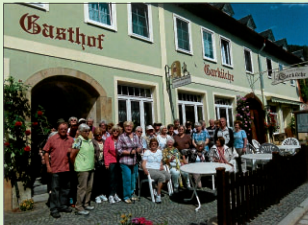
Nachträglich ein Bild von der Wanderwoche im Thüringer Wald vom 17.06. -26.06.2012