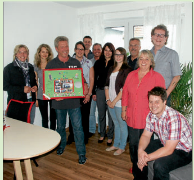
Unser Bild zeigt die Mitglieder der Freien Wähler gemeinsam mit dem Kindergartenpersonal und Bürgermeister Weinstein bei der offiziellen Übergabe der neu renovierten Räumlichkeit

Bürgermeister Weinstein freute sich mit dem Team des Kindergartens und lobte die Fraktionsmitglieder ausdrücklich und dankte ganz herzlich für dieses besondere ehrenamtliche Engagement.