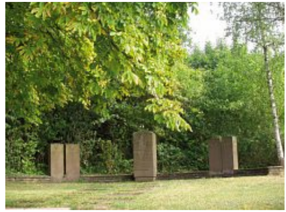
Ehrenmal in Rohrau

Die Feier findet in Rohrau am Sonntag, den 18. November 2012 gegen 11.00 Uhr beim Mahnmal neben dem Friedhof statt.