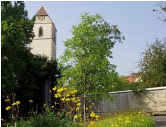
Ehrenmal in Gärtringen

Am kommenden Sonntag ist Volkstrauertag. In Gedenkfeiern gedenken wir der Opfer von Krieg und Gewaltherrschaft und bitten um Verständnis und Versöhnung untereinander.