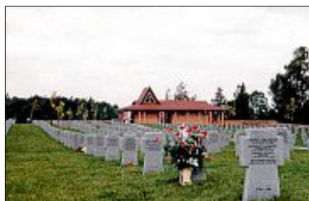
Kriegsgräber stätte in Saldus / Lettland, hier ruhen 2 Gefallene aus Gärtringen.

In vielen Orten und Ländern mahnen Kriegsgräberstätten gegen Krieg und Vergessen. Der Volksbund Deutsche Kriegsgräberfürsorge hat es sich unter anderem zur Aufgabe gemacht, diese Mahnmale zu errichten und zu pflegen.