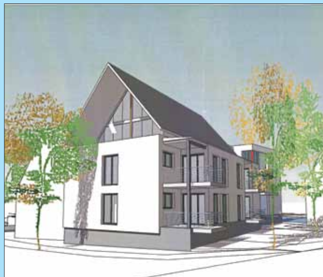
Ansicht Ecke Gärtringer- Hildrizhauser Straße