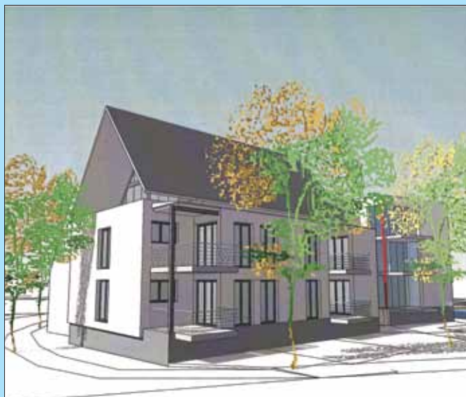
Ansicht von der Rathausseite bzw. Bushaltestelle. Hier ist auch der zweite modernere Flachdachbaukörper des Mehrfamilienhauses erkennbar

Telefonisch ist die Mitarbeiterin des Büros Bahr unter 07031/9416956 oder mobil unter 01604420562 erreichbar. Dieses Projekt ist auch für Kapitalanleger geeignet, die keine eigene Nutzung vorsehen !