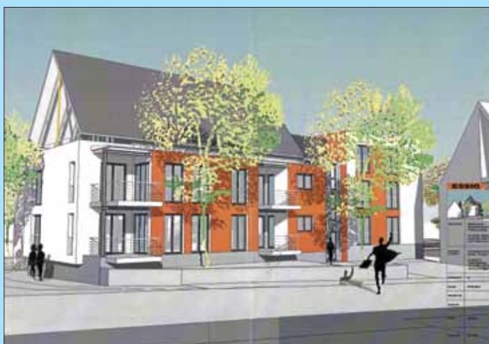
Ansicht von der Hildrizhauser Straße