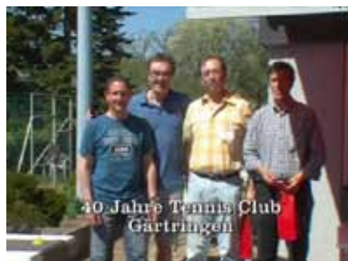
40 Jahre Tennis Club Gärtringen