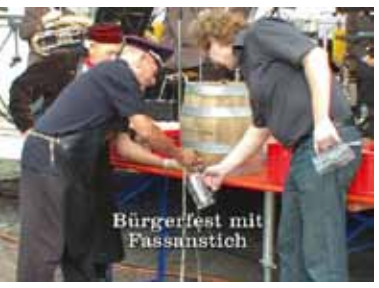
Bürgerfest mit Fassanstich