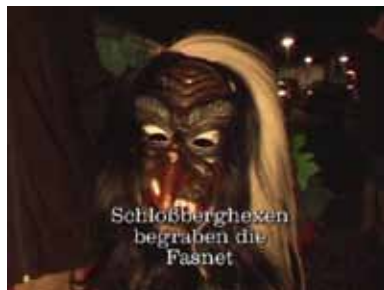
Schloßberghexen begraben die Fasnet