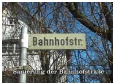
Sanierung der Bahnhofstraße