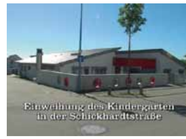
Einweihung des Kindergartens in der Schickhardtstraße