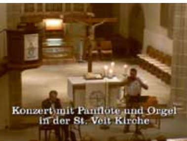
Konzert mit Pflöte und Orgel in der St. Veit Kirche