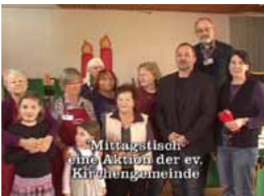
Mittagstisch eine Aktion der ev. Kirchengemeinde