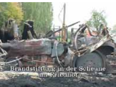
Brandstiftung in der Scheune am Friedhof