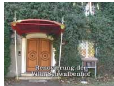
Renovierung der Villa Schwalbenhof