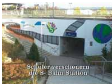
Schüler verschönern die S- Bahn Station