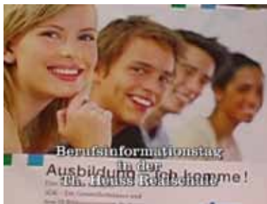
Berufsinformationstag in der Ausbildung an der TH. Heuss Rohrauhof