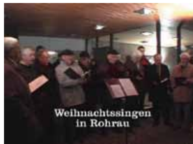
Weihnachtssingen in Rohrau

Filmvortrag im Rahmen der Volkshochschule.