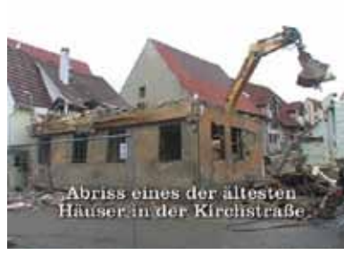
Abriss eines der ältesten Häuser in der Kirchstraße