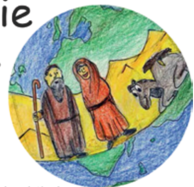
Mit Sarah und Abraham auf Wüstentour

Do 30.10. 14.30-17.00 Uhr Fr 31.10. 14.30-17.00 Uhr Sa 01.11. 14.30-17.00 Uhr So 02.11 10.00 Uhr Familiengottesdienst in der Christuskirche Rohrau