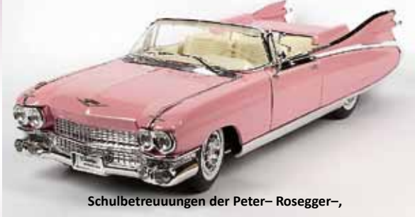
Schulbetreuungen der Peter-Rosegger-, Ludwig-Uhland-, und Joseph-Haydn-Grundschule

„Lena und ihre Freunde halten zusammen auch wenn es mal schwierig wird. So helfen sie Andy in der Schule, nehmen Johnny, den „Neuen“ mit in die Gruppe auf. Hierbei erleben sie ein Chaos an Gefühlen. Am Schluss sind sie sich alle einig – Freundschaft ist wichtig.“