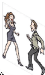
Jive, Disco Fox, Salsa