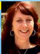
Elke Zinßer Kolumnistin