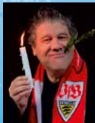
Klaus Birk Kabarettist