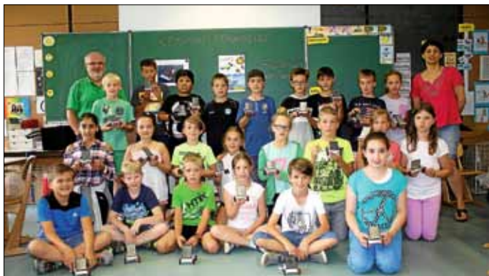
Viertklässler der PRS