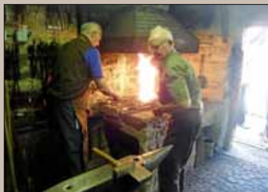
Alte Schmiede Rohrau

Die Sandmühle und die Alte Schmiede in Rohrau bieten einen wertvollen Beitrag zur Heimatgeschichte von Gärtringen-Rohrau. Die beiden kleinen Steingebäude, die sich versteckt hinter den Gebäuden der Ecke Gärtringer-/Hildrizhauser Straße befinden, legen vom beschwerlichen Leben der Sandbauern und Handwerker des 19. und beginnenden 20. Jahrhunderts deutlich Zeugnis ab. Die Sandmühle zeigt die beschwerliche Arbeit zur Gewinnung von Gips und Sand und gewährt Einblick in das Leben der Sandbauern vom Brechen des Sandsteins in den Sandsteinbrüchen oberhalb des Ortes am Schönbuchrand über das Mahlen des Sandes zum Rohrauer Silbersand bis hin zum Vertrieb des Sandes.