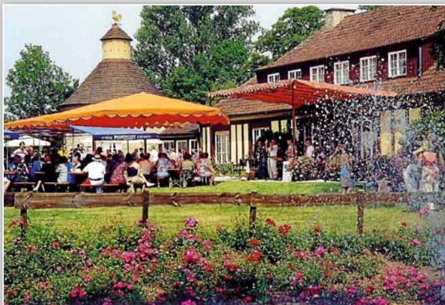
Jazz im Park

Bei unklarem Wetter Telefonansage unter 07034-923106 beachten!