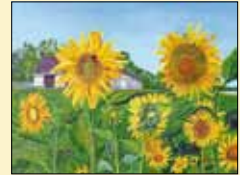
Vier Jahreszeiten im Lammtal