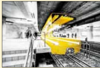
Schloßplatz Ghost Tram

Der Gärtringer Fotograf Emmanuel Zouboulis stellt derzeit seine Bilder im Gärtringer Rathaus aus.