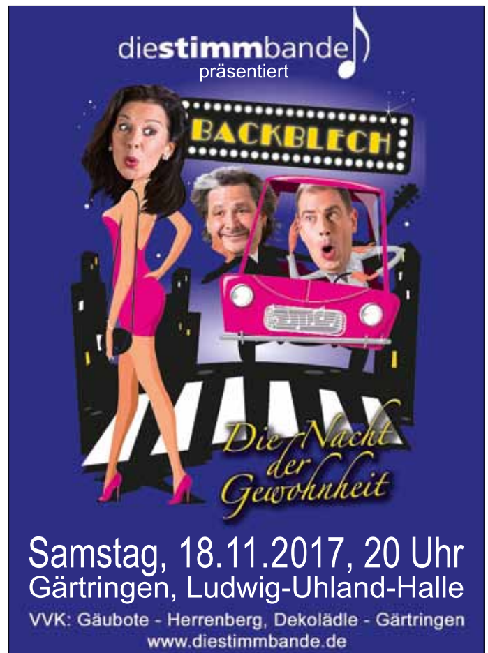
Plakat: Stimmbande Gärtringen e. V.