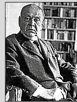
Friedrich Sieburg in der Villa Schwalbenhof