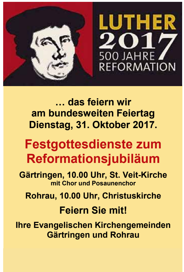
Plakat: Evang. Kirchen Gärtringen/Rohrau