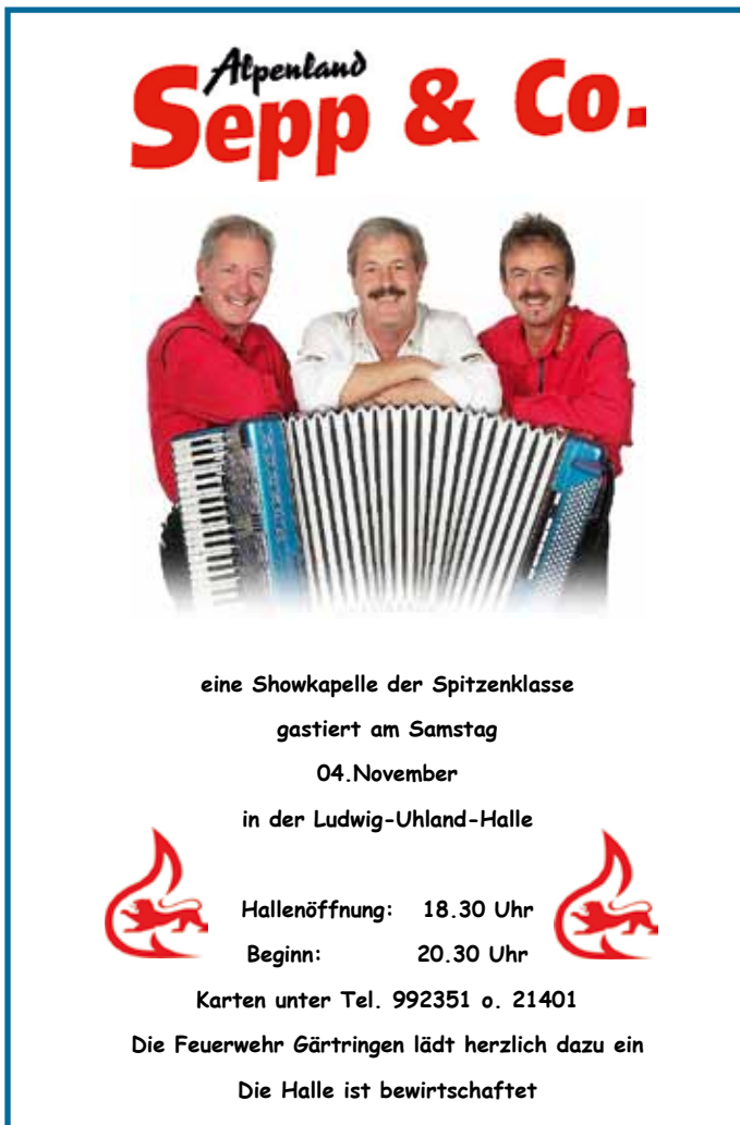
Plakat: FW Gärtringen