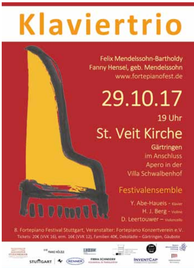
Plakat: Fortepiano Konzertverein