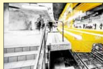
Schloßplatz Ghost Tram

Die sehenswerten Exponate können bis zum 04. Dezember 2017 im Rathaus Gärtringen, Rohrweg 2, während der Öffnungszeiten, Montag bis Freitag 8.30 Uhr – 12.00 Uhr, und Donnerstag 14.00 Uhr – 18.30 Uhr besichtigt werden.