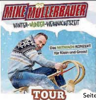
Plakat: Evang. Kirche Gärtringen