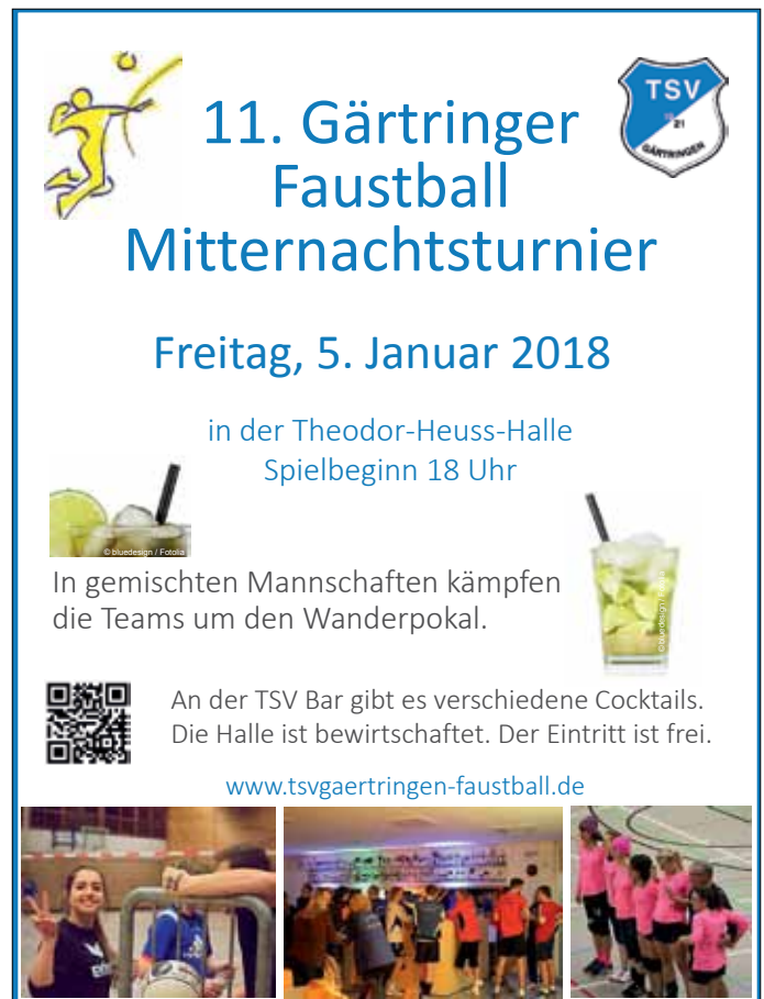
Plakat: TSV Gärtringen Faustball