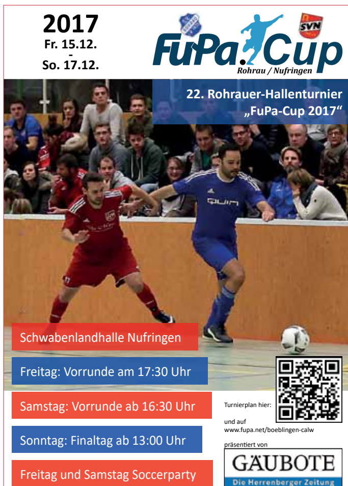
Plakat: SV Rohrau