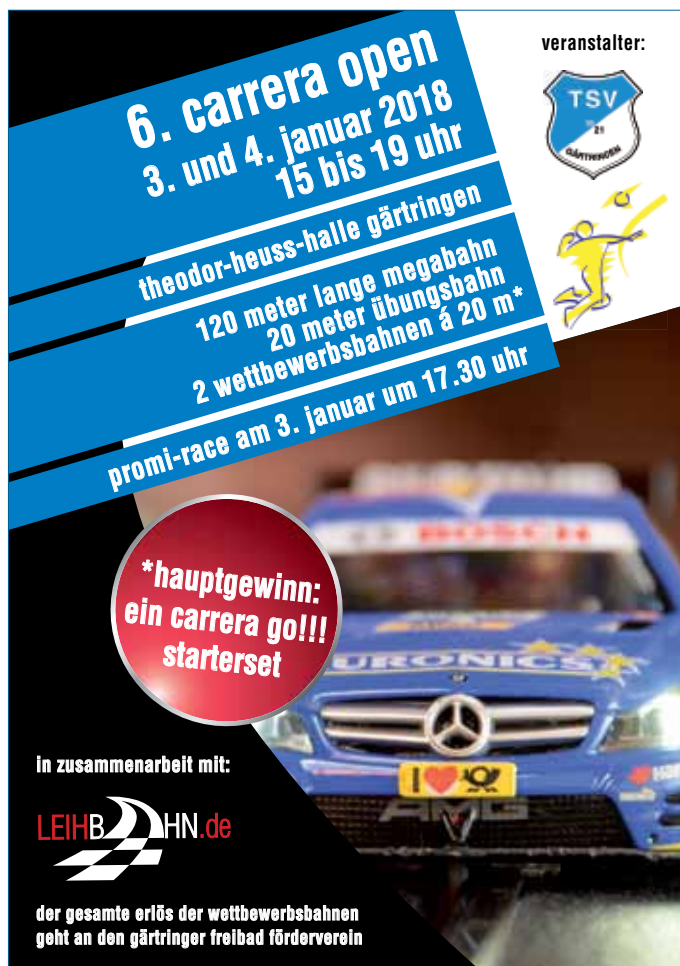
Plakat: TSV Gärtringen Faustball