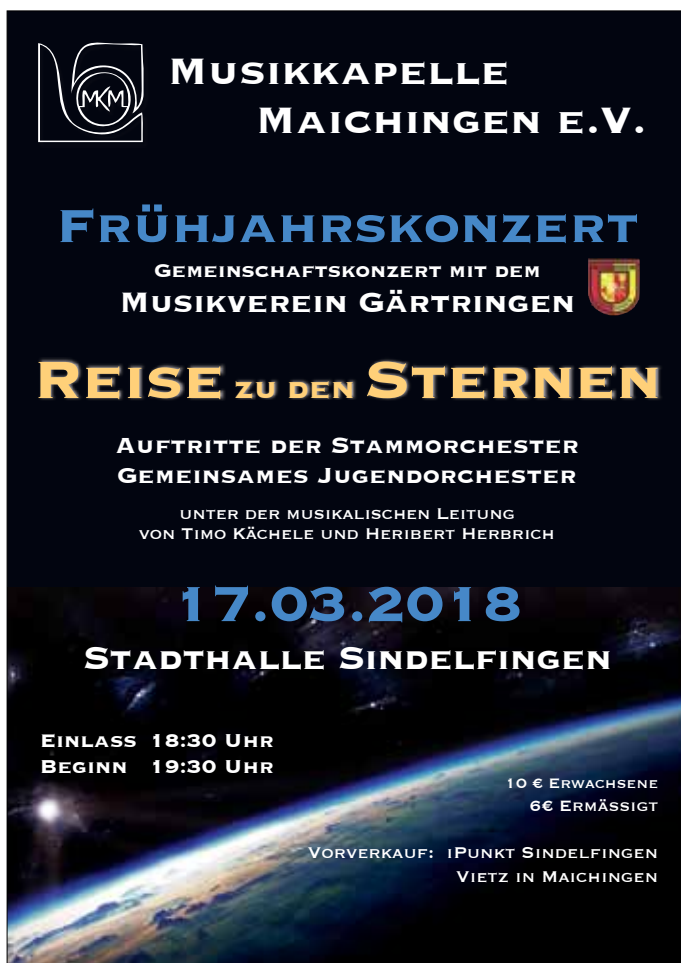
Plakat: Musikverein Gärtringen