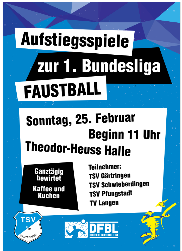
Plakat: TSV Gärtringen Faustball