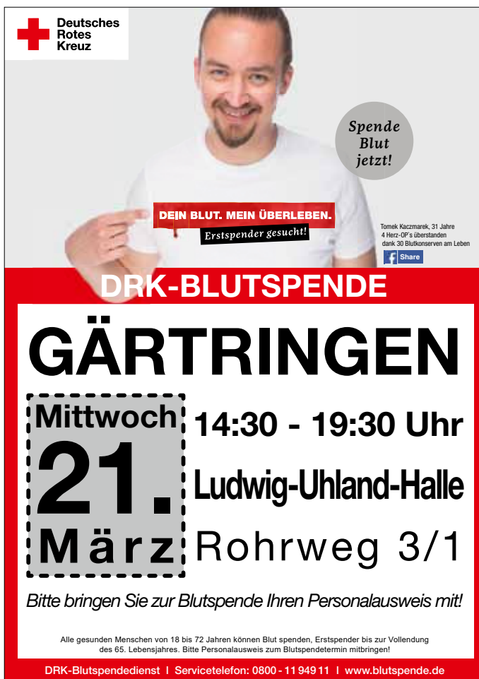
Plakat: DRK Gärtingen