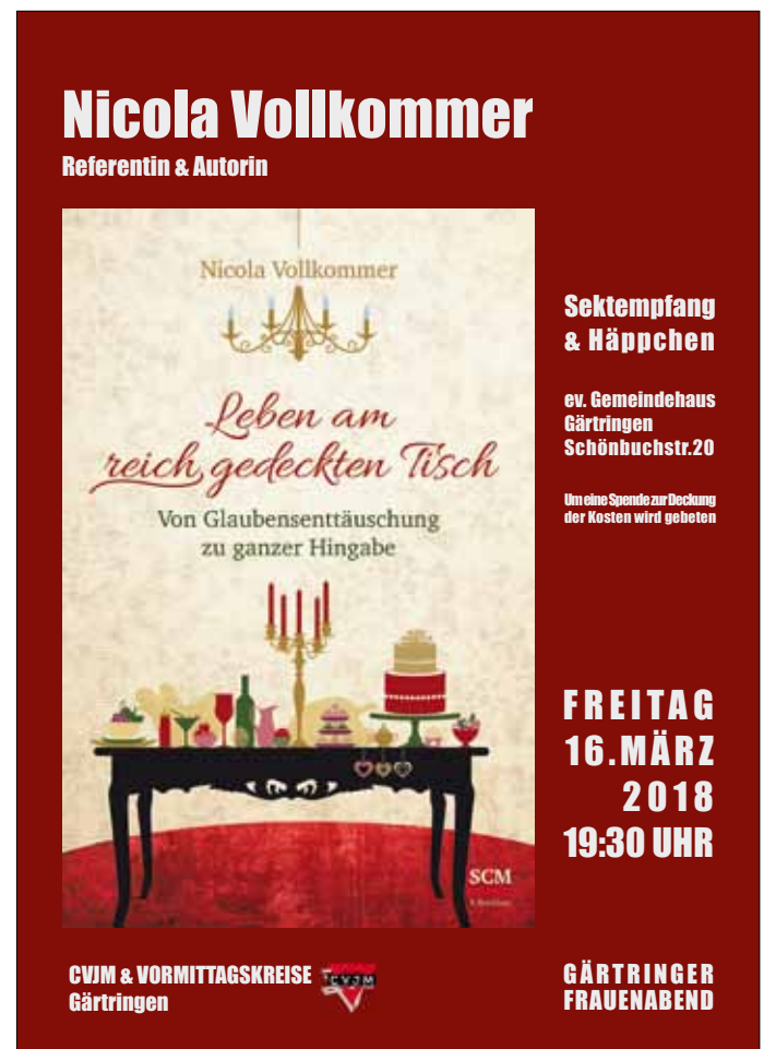
Plakat: CVJM Gärtingen