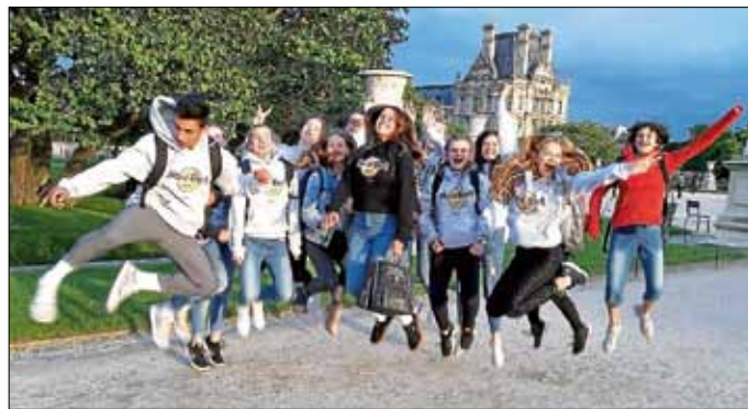
Theodor-Heuss-Realschule in Paris

Die Tage waren ereignisreich, anstrengend (ca. 15 km Tagesleistung!), lustig, aufregend ... insgesamt ein bleibendes Erlebnis! Trotz der manchmal widrigen Umstände war die Laune aller immer ausgezeichnet, was zum guten Gelingen der Studienfahrt sehr beigetragen hat.