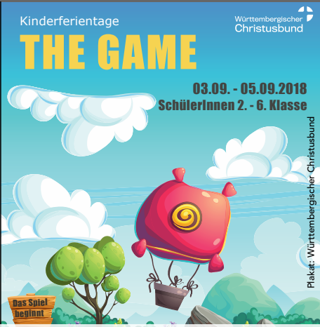
Plakat: Württembergischer Christusbund