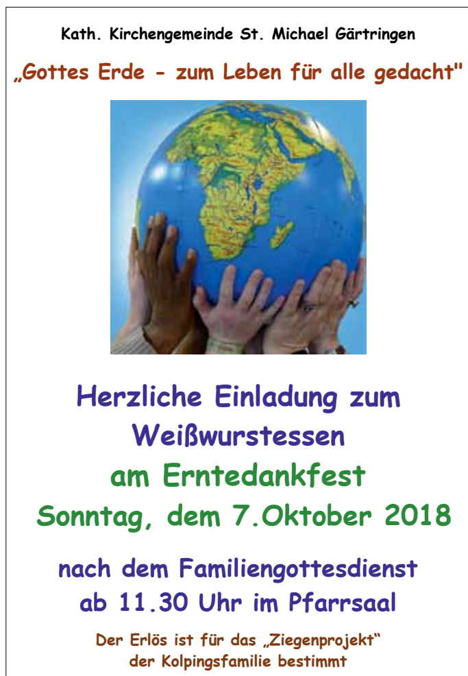
Plakat: Kath. Kirche Gärtringen