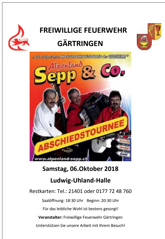
Plakat: FW Gärtringen