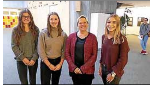
„Klassentreffen“ mit Kultusministerin Frau Dr. S. Eisenmann

Für unsere Schülerinnen war es eine tolle Erfahrung einen Einblick in die aktuelle Schulpolitik und die Arbeit des Schülerbeirats zu erhalten. Das Foto mit der Ministerin durfte als Erinnerung natürlich auch nicht fehlen.