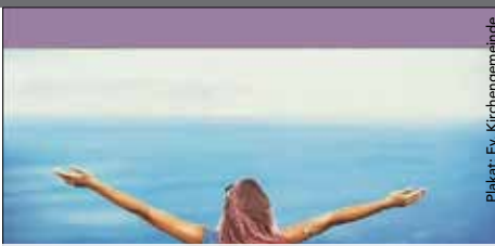
Plakat: Ev. Kirchengemeinde

MITTEILUNGSBLATT DER GEMEINDE GÄRTRINGEN