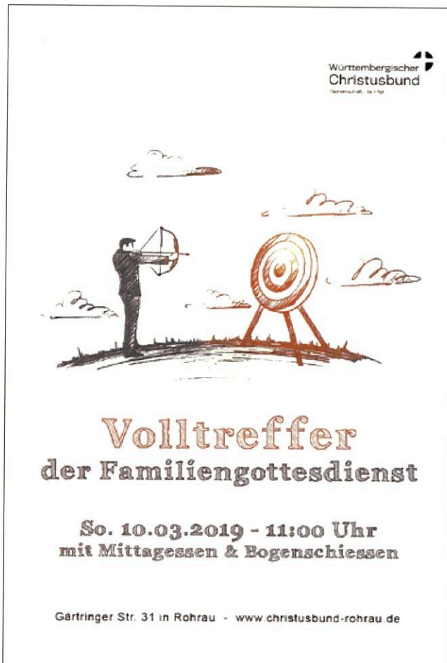
Plakat: Württembergischer Christusbund