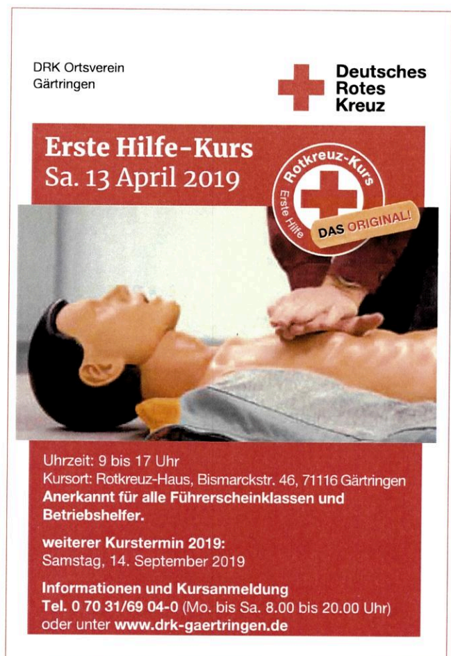
Plakat: DRK Gärtringen