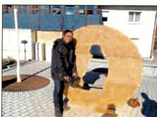
Unser Foto zeigt einen Modellentwurf des Künstlers aus Holz